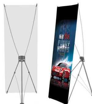
可 自行 攜帶 X 展架 (設計內容、展架須廠商自行提供)